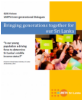
පරම්පරාවෙන් පරම්පරාවට වූ කතිකාව - සිංහල සහ දෙමළ මාධ්‍ය වලින් ලබාගත හැකිය (2015)