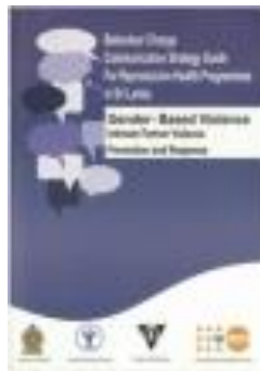
ශ්‍රී ලංකාවේ ප්‍රජාතන සෞඛ්‍ය වැඩසටහන් සඳහා වර්ගාවන් වෙනස් කිරීමේ සන්නිවේදන ක්‍රමෝපායයක් (2014)