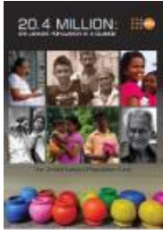
ශ්‍රී ලංකාවේ මිලියන 20.4 ජනගහනය පිළිබඳ සාරාංශයක් (2015)