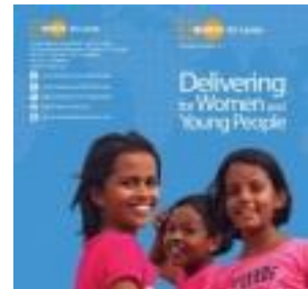
Delivering for Women and Young People (2014) කාන්තාවන්ට සහ තරුණ ජනතාවට සේවා ලබාදීම