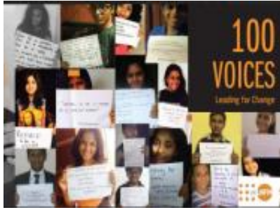
100 Voices වෙනසක් ඇතිකිරීම සඳහා වූ විශේෂ ව්‍යාපාරය (2015)