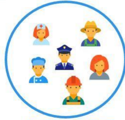
15 - 59 வயதுக்கு இடைப்பட்ட சனத்தொகை