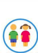
15 வயதுக்குக் குறைந்த சனத்தொகை