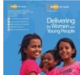
Delivering for Women and Young People (2014)