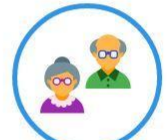
வயதும் அதைவிடக் கூடிய சனத்தொகை