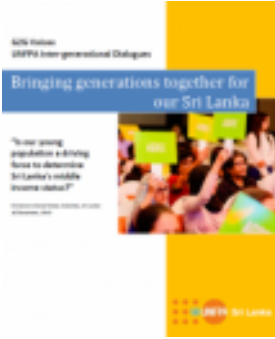
Generation to Generation Dialogue Available in Sinhala and Tamil (2015)