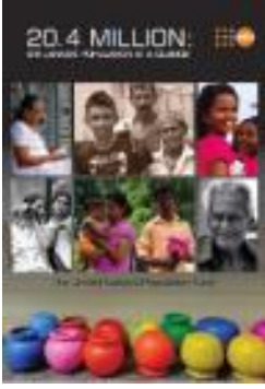
20.4 Million: Sri Lanka's Population at a glance (2015)