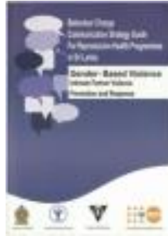
Behaviour Change Communication Strategy for Reproductive Health Programmes in Sri Lanka (2014)